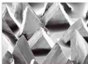
Grano Cerámico PSD (Precision Shaped-Grain) de 3M™

Como parte de su filosofía de constante innovación, 3M™ ha desarrollado una nueva tecnología para la línea de abrasivos llamada Cubitron™ II. Un novedoso grano cerámico capaz de cortar y desbastar más rápido que los discos comunes. Su composición en forma triangular se desliza sobre el metal como un cuchillo y se autoafila a medida que desbasta, permitiéndole al operador máximo rendimiento, lo que se traduce en una mayor productividad y ahorro de dinero. Además, durante el trabajo de desbaste no calienta la pieza ni la oscurece, como producto de la fricción, lo que sí ocurre con los abrasivos comunes.